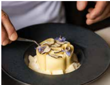
COFFRET ESCAPADE TRUFFÉE BOSCOLO NICE HÔTEL & SPA