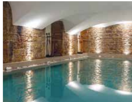
COFFRET RITUEL BOSCOLO BOSCOLO LYON HÔTEL & SPA

Offrez-vous une expérience truffée lors de votre séjour sur la Côte d'Azur et profitez en pour découvrir le SPA Deep Nature.