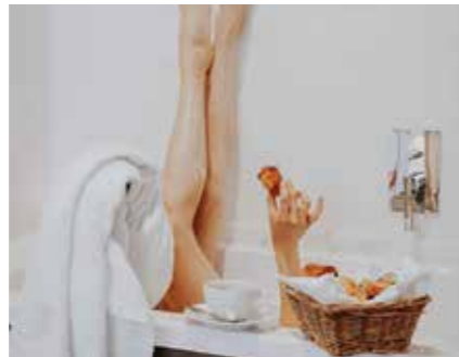
COFFRET ESCAPADE ROMANTIQUE BOSCOLO HÔTELS & SPAS